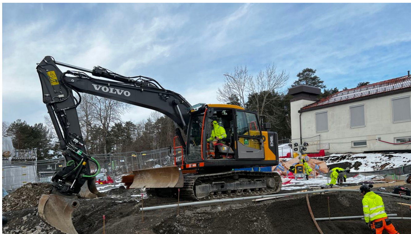
Det er mange i sving når underlaget klargjøres før støping. Betongpark har også sine egne maskinførere.