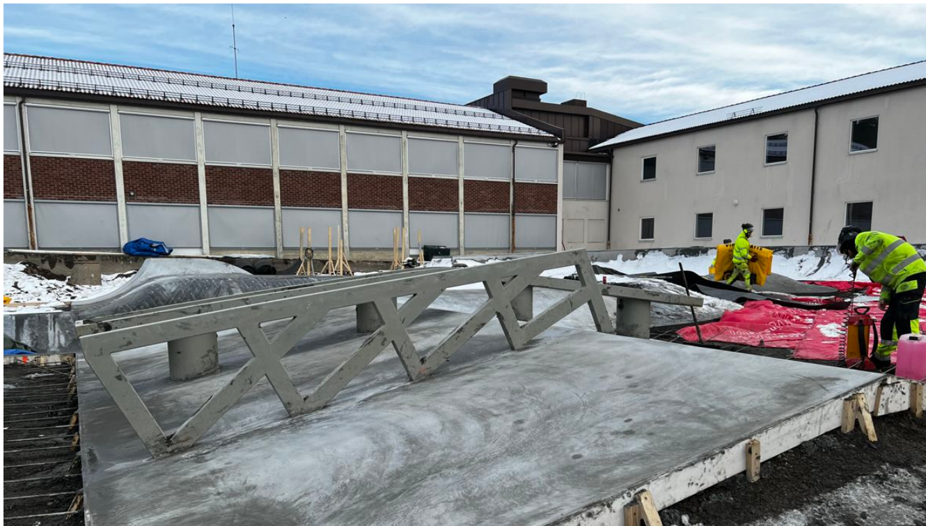
Parken skal treffe alle typer hjul, både rulleskøyter, sparkesykkel, skateboard, BMX og rullestol.